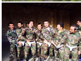
Esprit de groupe, partage ....